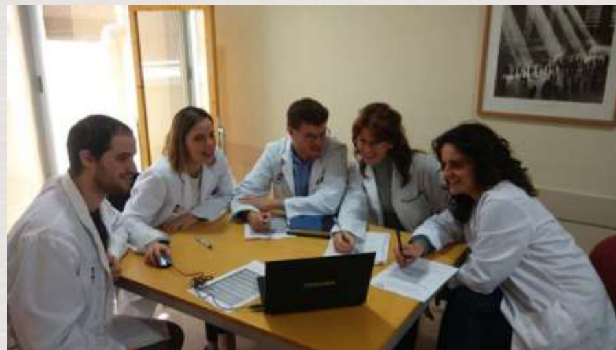
Equipo. El responsable